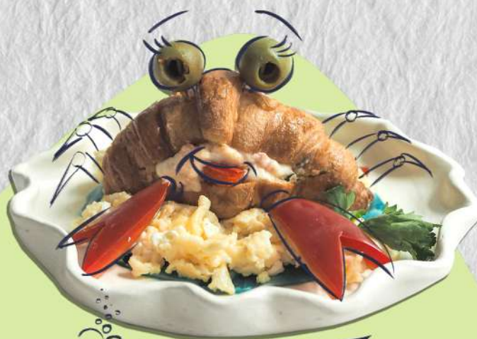
Крабик на рифе