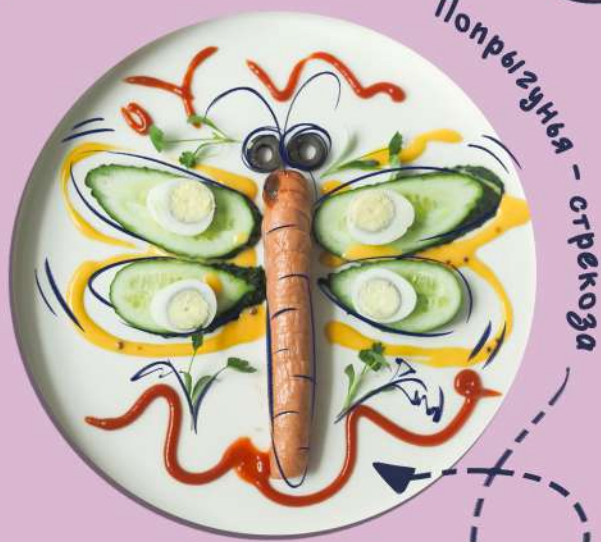
Попрыгунья - стрекоза